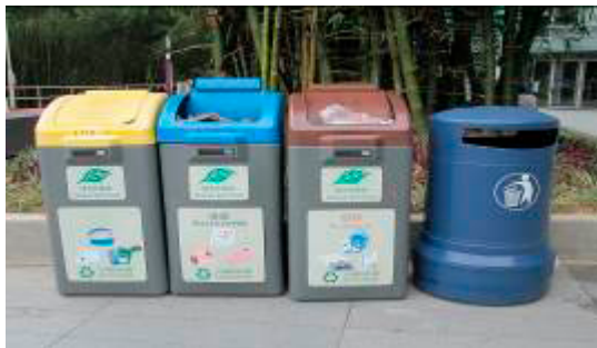
金屬、廢紙、塑膠回收箱