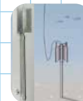
重力式取樣管鑽探海床